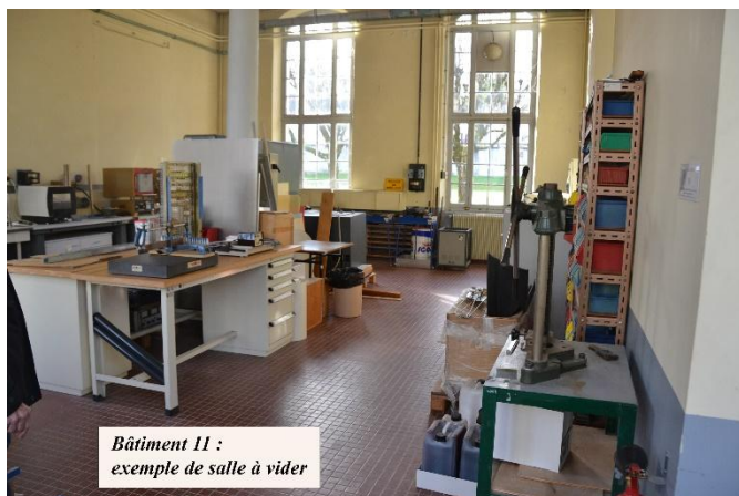
Bâtiment 11 : exemple de salle à vider