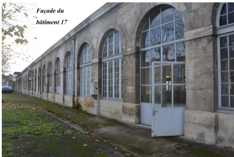
Façade du bâtiment 17

lancement du déménagement à la réalisation impérative d'un minimum de travaux préalables dans les bâtiments 011 et 017, afin d'assurer des conditions d'accueil appropriées, décentes et sécurisées.