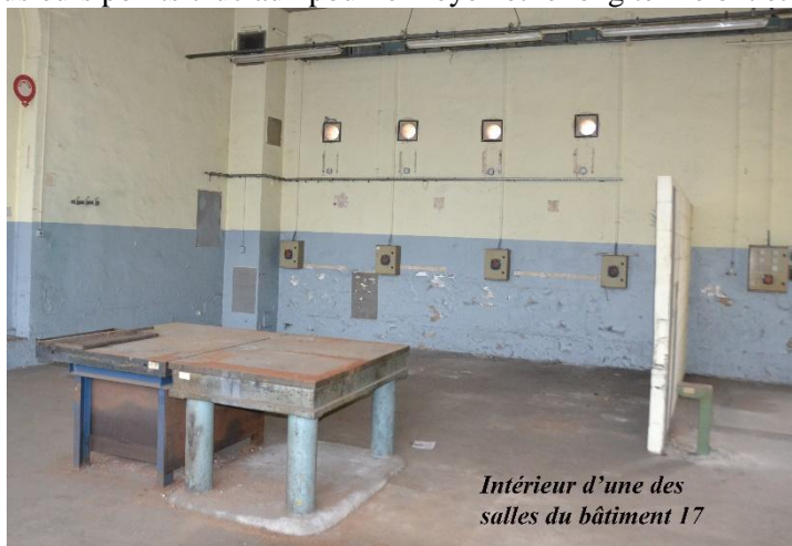
Intérieur d'une des salles du bâtiment 17